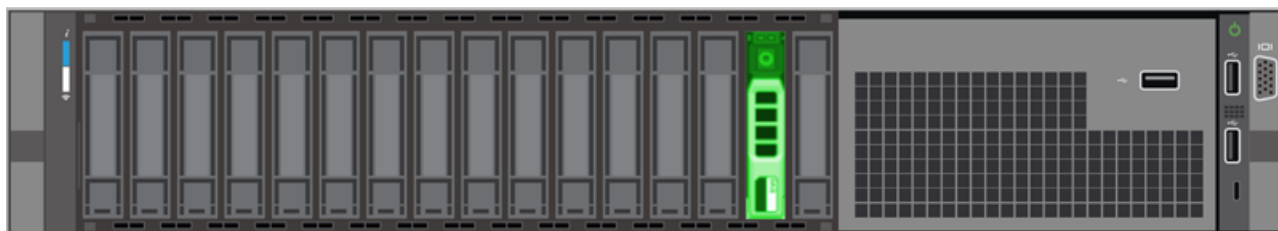
Figure 3: EDA 9200 et EDA 10200 - Emplacement 14