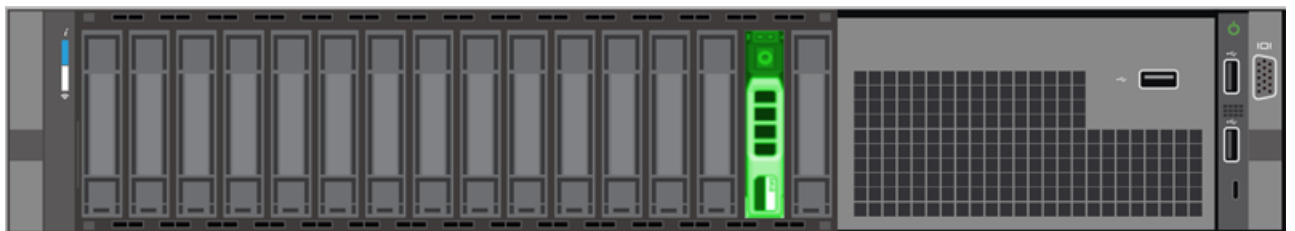
Abbildung 3: EDA 9200 und EDA 10200 - Steckplatz 14